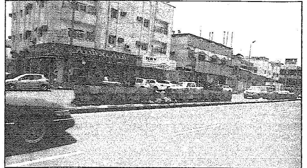
جانبا من طريق شهباز العام الذي يوازي للطريق الجديد