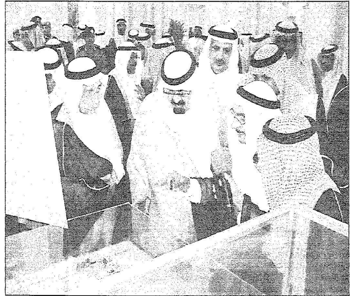
خدم الحرمين لدى رعاية حفل مشروعات الكهرباء و لعيام بالمدينة المنورة