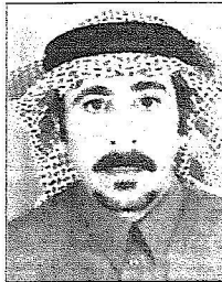
حمود بن محمد السعدي

ستضع البنية الأساسية لمشروع عدة في المنطقة وسيتم بحيرها كافة المواطنين. كما بين مدير فرع الزراعة بتيماء المهندس محمد بن مزروق العلوي بأن الخير لا يأتي إلا من أهل الخير ومليكا يحفظه الله محب وبذل للخير وما زيارته وجولاته التقديرية لكافة مناطق المملكة إلا تجسد لتلك. والجميع هنا في منطقة تبوك ينظرون لهذه الزيارة بصانق الحب والولاء بأن يكمل الله مساعي خادم الحرمين الشريفين بالتوفيق وأن يحفظ لنا مليكنا وديمق أمنا في ظل حكومتنا الرشيدة.