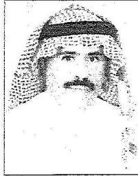
عبد بن جميع الملك