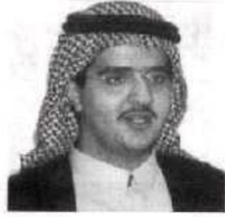
- الأمير عبدالعزيز بن فهد -

التي تضاهي مثيلاتها في المشافي الدولية، ومن أبرز المشروعات بهذا الصدد، تقنية مقدمي خدمات التطبيقات التي تمكن عدة مستشفيات من استخدام أنظمة متقدمة للمعلومات في مستشفى آخر يحتوي على تلك الأنظمة، ومن أهم مميزات هذه الطريقة عدم الحاجة إلى وجود الخبرات الفنية اللازمة لتشغيل وصيانة تلك الأجهزة والأنظمة، بل يتم ذلك في الجهة المقدمة لخدمة التطبيقات، وهذا يقلل بدوره التكاليف اللازمة لتطبيق أنظمة المعلومات المتطورة في المستشفيات، كما أن هذه التقنية تمكن من ربط عيادات الأطباء بمراكز المختبرات والأشعة والصيدليات، وربط الإداريين بشركات التأمين دون الحاجة لتطبيق الأنظمة اللازمة في كل عيادة ومستشفى أو صيدلية، ولكن بواسطة استئجار خدمة التطبيقات ويمكن للجميع الاستفادة من تبادل المعلومات بأسرع وقت وأرخص طريقة، وقد تبنت الشؤون الصحية بالحرس الوطني هذه التقنية وتم بناء مركز معلومات موحد لجميع مستشفيات وعيادات الحرس الوطني.