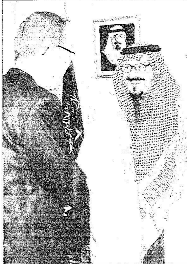
الامير سلطان مستقبلا بان كي مون

استقبل صاحب السمو الملكي الأمير سلطان بن عبدالعزيز آل سعود ولي العهد نائب رئيس مجلس الوزراء وزير الدفاع والطيران والمفتش العام بمقر إقامة سموه في مدينة نيويورك يوم أمس الأول الأمين العام للأمم المتحدة بان كي مون. وفي بداية الاستقبال ضمن الأمين العام للأمم المتحدة دعوة خادم الحرمين الشريفين الملك عبدالله بن عبدالعزيز آل سعود للحوار بين أتباع الأديان والثقافات الذي عُقد مؤخراً في مقر الأمم المتحدة، وشارك فيه عدد كبير من زعماء دول العالم. وأكد الأمين العام أنه سيتابع ما ينتج عن الاجتماع لتحقيق الفائدة المرجوة منه لإيجاد التقارب والسلام بين