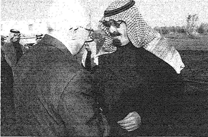
المملك لدى استقباله الرئيس محمود عباس في روضة خريم.