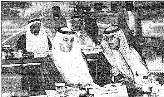
الاميران نايف بن سلمان وحمد بن فهد بن سلمان

وعندما تساهل محمد المشوحي رجل الاعمال عن انشاء مدينة اعلامية ضمن المشاريع التي اطلقها خادم الحرمين الشريفين في شهر ربيع الاول المتصرم أوضح سموه ان موضوع المدينة الاعلامية تم بحثه بالهيئة