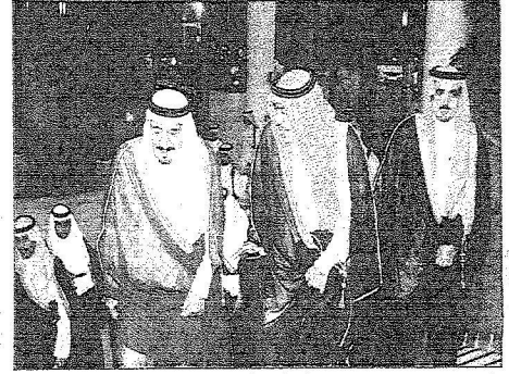
الأمير سلمان لحظة وصوله مقر اللقاء