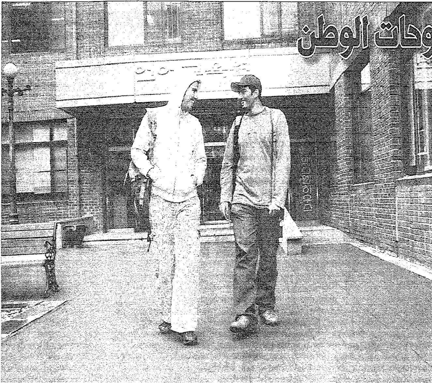
طلابان سعوديان مبتعثان في الخارج أثناء مفارقتها مبنى الجامعة

المملكة العربية السعودية وزارة التعليم العالي Ministry of Education, Saudi Arabia