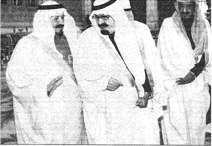
خادم الحرميت الشريقتين لحظة وصوله الرياض وكان في استقباله سمو ولي العهد والأمير سلمان