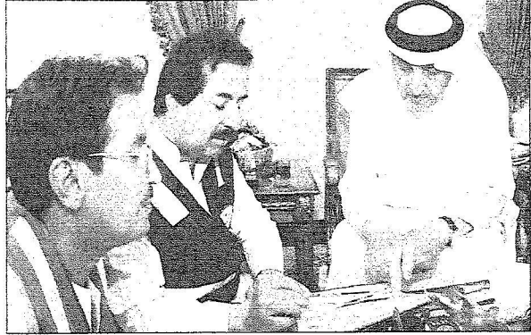
الأمير خالد الفيصل يتطلع على الوضع الصحي للحجاج

حضر الاستقبالات مدير عام مكتب سموه الدكتور عقاب اللويحق.