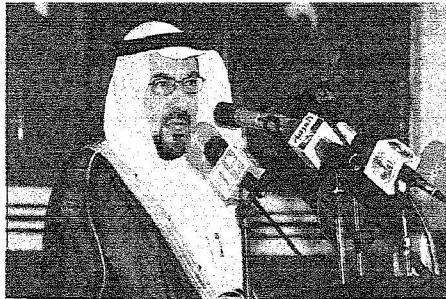
وزير الثقافة يلقي كلمة خادم الحرمين