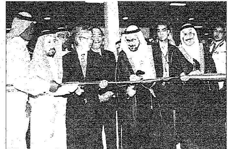
وزير الثقافة ووالي جواره ياماموتو يقصان الشريط إيفاداً بانفتاح المعرض

تحت رعاية خادم الحرمين.. وزير الثقافة افتتح معرض الرياض الدولي للكتاب.. وكرم رواد صحافة الأفراد