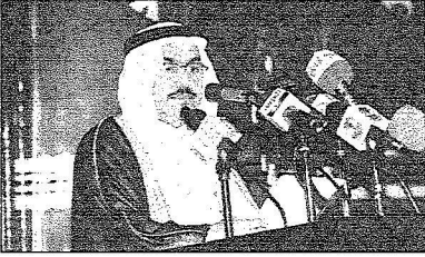
وكيل وزارة الثقافة د السبيل بلقي كلمته