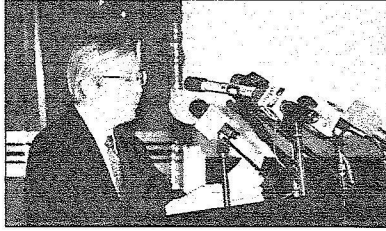
مدير الشؤون الدبلوماسية بالخارجة اليابانية بلقي كلمته