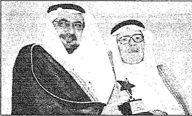
ويكرم عبدالفتاح ابو مدين