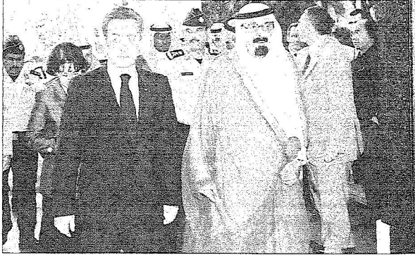
خادم الحرمين الشريفين خلال لقائه بالرئيس الفرنسي ساركوزي