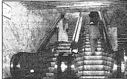
سلام كهربائية من المواقف للحرم

من غيرهما من مواقف السيارات الأخرى. أما التسيية لذوي الاحتياجات الخاصة فقد خصصت لهم مصاعد كهربائية لتقلهم من المواقف إلى أبواب الحرم مباشرة وتوسع لعدة أشخاص مع عرباتهم ومراقبتهم.