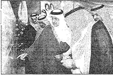
..ويستمع الى شرح عن احد المشاريع