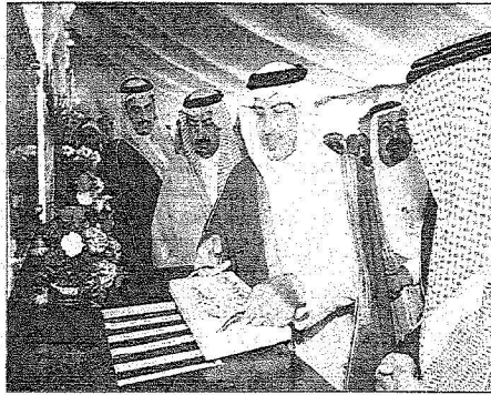
يضع حجر الأساس لمشروع صحي