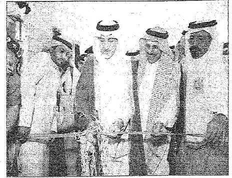
الأمير خالد الفيصل يفتتح أحد المشاريع التعليمية