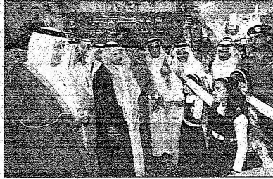
طالبات من مناريس رنية يرحبن بسموه

الفأ و ٨٩٨ ريالاً وتتمثل هذه المشاريع في زيادة السعة السريرية لمستشفى رنية العام من ٥٠ سريرا الى ١٠٠ سرير وأنشاء مبنى الطوارئ بالمستشفى بتكلفة اجمالية بلغت نحو ٦ ملايين و ١٩٦٧ لفا و ٩٨٢ ريالاً بالإضافة الى مركز الكلى الملحق بالمستشفى بتكلفة مليون و ٩٩٩ الفاً و ٩١٦ ريالاً وأنشاء ٣ مراكز صحية تتبع للمحافظة في كل من الامح والعيولة ورنينة بتكاليف اجمالية بلغت نحو ١٠ ملايين و ٤٥٨ الفاً.