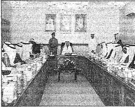
أمير مكة لدى لقائه مع أعضاء المجلس المحلي بمحافظة رنية

منسوبي قطاع التعليم بما فيهم الطلاب والطالبات بالمحافظة (مس الانباء).