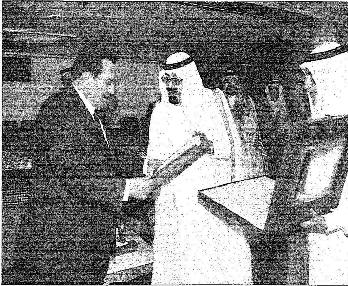
الملك عبد الله يسلم الرئيس المصري وثائق التنازل عن السفيتين كهدية من شعب المملكة لشعب مصر.