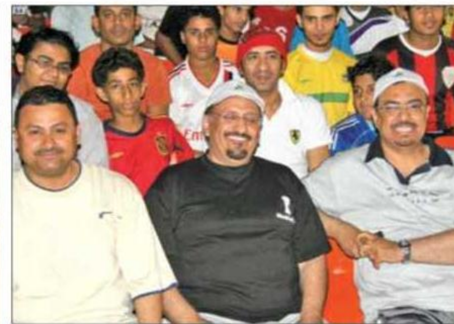
وكلاء إمارة جازان يشاركون في سباقات المهرجان

الحفل عن سعاده بالمشاركة، وما شهده المهرجان من حضور لافت، ونجاحات مميزة في مختلف فعالياته، وقال: أنا سعيد جداً بما شاهدته الليلة من عروض نالت استحسان الحضور، مشيراً إلى تميز المهرجان من عام لآخر لتحقيق الأهداف المرجوة منه في التعريف بتراث المنطقة وما تزخر به من مقومات جعلتها في مصاف المناطق السياحية. وجسد سموه الدعوة لرجال الأعمال للاستثمار في منطقة جازان في مجالات الفنادق والشقق المفروشة وغيرها من المجالات التي تساهم في تنمية المنطقة سياحياً.