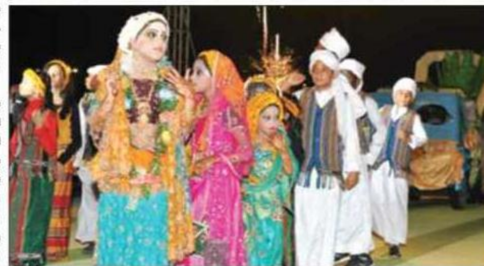
أطفال جازان يشاركون في المهرجان الشتوي

واشتمل الكرنفال على العروض الشعبية واللوحات التراثية التي تبرز تراث المنطقة وفنونها الشعبية، والأزياء، وما تميزت به المنطقة من حرف وأعمال يدوية في مجالات الزراعة، والصيد، والغوص، وتجارة اللؤلؤ، والأدوات المستخدمة في تلك الحرف، وليلة الزفاف في جازان، إلى جانب المسيرة الكرنفالية على