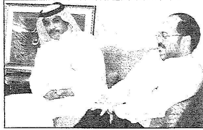
رئيس بعثة حج إيران مسعود مجري خلال لقائه المسؤولين عن خدمة الحجاج بالدينية

وقال: إن التطور النوعي والكمي الذي تشهده خدمات الحج والتسهيلات المقدمة في كل عام وفي مختلف المواقع دليل صادق على اهتمام المسؤولين في المملكة بقيادة خادم الحرمين الشريفين الملك عبدالله بن عبدالعزيز حفظه الله، منوها بما لمسه شخصياً وحجاج بلاده من سرعة في إنهاء إجراءات القدوم في زمن قياسي. وأضاف بأنه لا دل على ذلك من المشروعات العملاقة التي نفذت في مكة المكرمة والمدينة المنورة والمشاعر المقدسة، مشيراً إلى أن هذه الأعمال هي محل فخر واعتزاز المسلمين في شتى أنحاء المعمورة، وأكد أن الحجاج اليمنيين يتابع توافد قلوبهم إلى المملكة لتأدية فريضة الحج وفق ما هو محدد كما أن جميع من يتواجد هنا يفتخرون بالصحة والخدمات التي توفر لضيوف الرحمن.