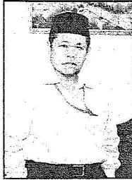
رئيس بعثة إندونيسيا أحمد كارثونو

الخدمات المقدمة للحجاج الجزائريين من مختلف القطاعات بالمدينة ووصفها بأنها كانت مميزة أسهمت في راحة الحجاج جميعاً.