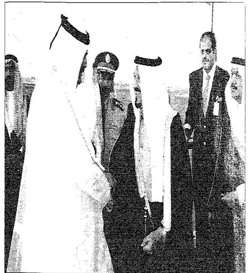
أمير قطر في مقدمة مستقبلي سموه بالمطار