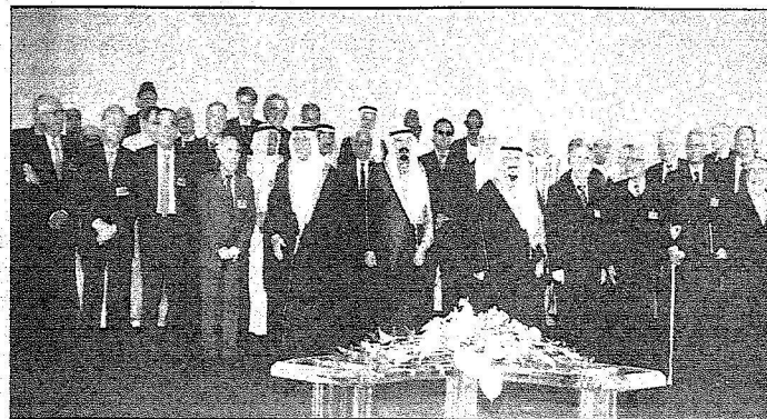
خادم الحرمين وولي العهد في صورة تذكارية مع الفلانيين