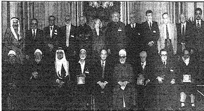
صورة تذكارية تجمع الفلانيين بجوانك سابعة للجائزة

التاريخ : 06-05-2008 العدد : 14561 الصفحات : 14 المسلسل : 17