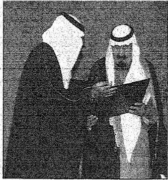
خدم الحرمين خلال تسلمه الجائزة