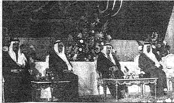
للكهيد - رحمه الله - راعياً لإحدى الجوائز بحضور الأمير سلمان والأمير عبدالله الفيصل - رحمه الله - والأمير خالد الفيصل