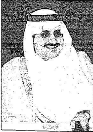
الأمير فهد بن سلطان