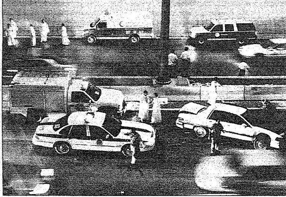
التهور في القيادة سبب هذه الحوادث