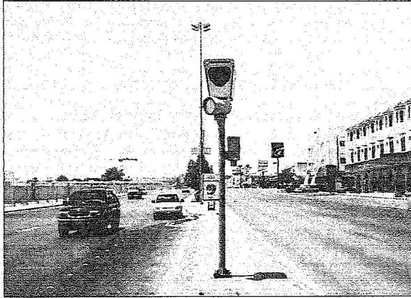
الكاميرات سوف تتابع الانحطامات