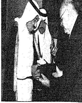
الأمير سلمان بن عبدالعزيز آل سعود