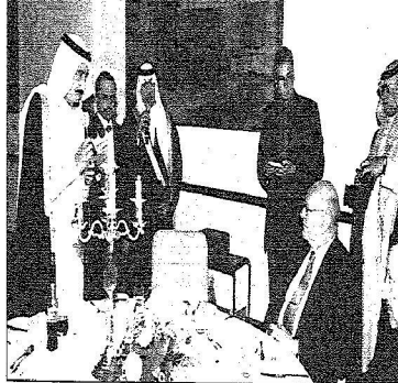
الأمير سلمان بن عبدالعزيز آل سعود في مكتبه