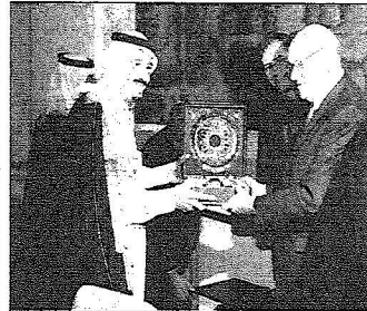
الأمير سلمان ورئيس مجلس النواب يتبادلان الهدايا

المسؤولين في ألمانيا على حفاوتهم بزيارتي والتي تجسد حفاوة ألمانيا ببلادي.