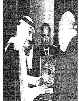
معه أمير الرياض محمد بن عبد العزيز آل سعود

في إطار زيارته لمجلس النواب بمدينة برلين