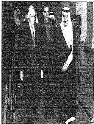
رئيس مجلس النواب كاتن في استقبال أمير منطقة الرياض