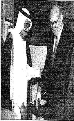
الرئيس مومبر برفقة أمير الكويت

مومبر: يعمنا تعزيز العلاقات مع أهم دولة تطل على الخليج العربي