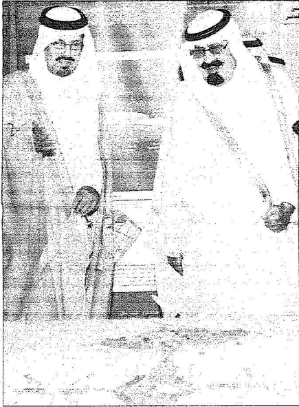
الملك يشاهد مجسماً لأحد المشاريع ويظهر الأمير سعود بن عبد المحسن

التشريعيين تشدين عدد من المشاريع التنموية المهمة في منطقة حائل مؤكدا حرص واهتمام القيادة الرشيدة على تشجيع إقامة مثل هذه المشروعات التنموية والخيرية.