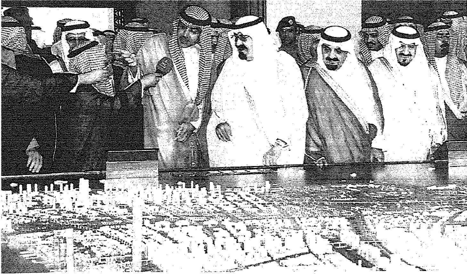
الملك يطلع على مجسم المدينة الاقتصادية