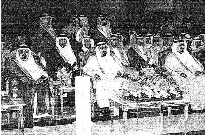
..ولدى رعايته حفل وضم حجر أساس عدد من المشاريع