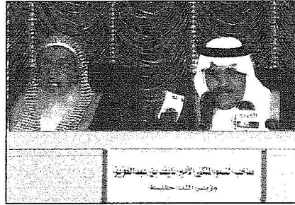
بمعه يوجه كلمته للحضور

تغطية - علي الشثري ، ( واس ) : تصوير - نايف الحربي