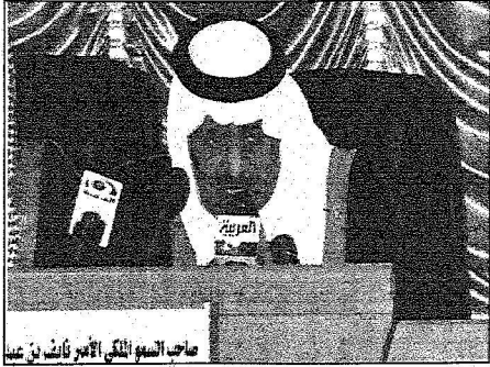
الأمير نايف متحدثاً