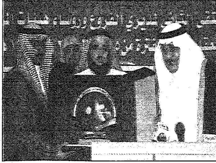
الأمير نايف يلقى كلمةً تذكاريةً من مشيوي الهيئة