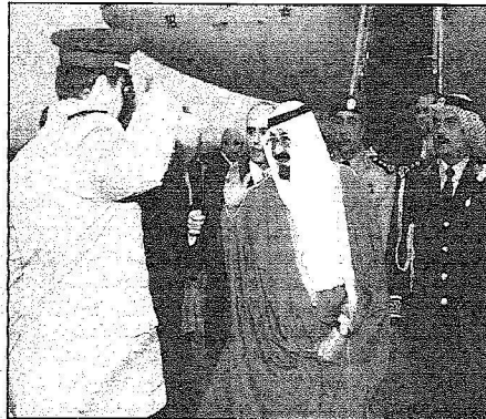
أركان السفارة السعودية في استقبال خادم الحرمين لدى وصوله إلى واشنطن..