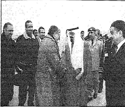
مفارقة خادم الحرمين الشريفين ثوبويوك (و. أ. س.)

فادم الحرمين تسلم هدية من الطلبة: بارك الله فيكم أنتم هديتي