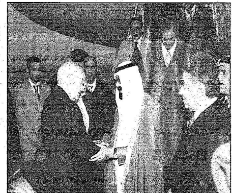
خادم الحرمين مصطحباً نائب الرئيس الأمريكي لدى وصوله إلى قاعدة لندرون الجوية في واشنطن.. (و. أ. س.)