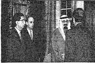
استقبال خادم الحرمين الشريفين للملحق الثقافي السعودي بأمريكا ومجموعة من الطلاب السعوديين المتبعين.. (و. أ. س.)