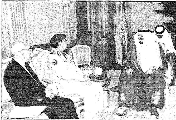
نائب الملك يستقبل وزير الدفاع اليمني