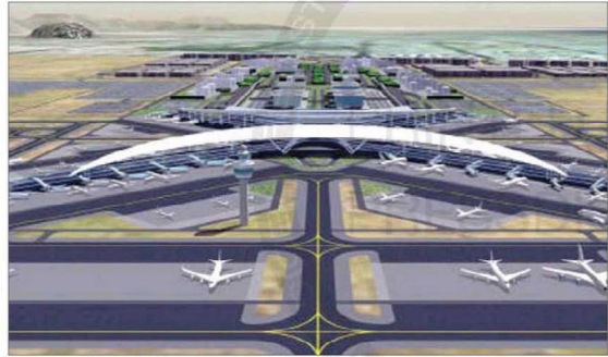
مخطط وتصميم لمطار الملك عبد العزيز الدولي الجديد