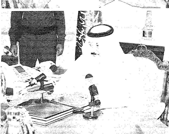
النائب الثاني خلال تروسة الجراحة الأولى للاجتماع الـ 17 لأمره المناطق