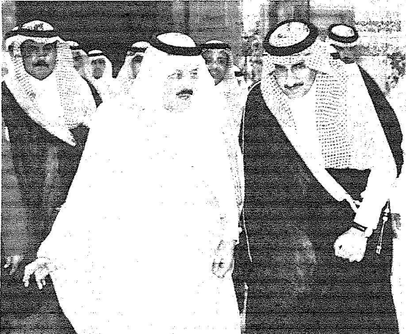
النائب الثاني والى جواره الأمير محمد بن كافي قبيل الاجتماع