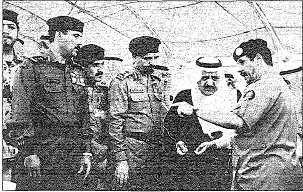
( اليوم )

ويعد هذا المشروع شرياناً لتيسير حركة السير في مكة المكرمة في غير اوقات الحج ويسهل الحركة للزوراء للقادمين من جدة عبر طريق مكة المكرمة الطائفة الى حيث ينقل الحركة من شمال منى الى طريق مكة جدة الطائفة السريع في منطقة (كدي) دون وجود أي اشارات ضوئية كما يسهم في ايجال الخدمات والمرافق الى المشاعر المقدسة ومنها ويسهل الوصول من المشاعر المقدسة الى المسجد الحرام.