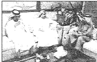
رئيس تنفيذية الغرفة يتحدث مع مومم القطاع الخاص مع رئيس البلدية

والمسؤولين لتحقيق المزيد من التفاعل والتفاهم .. وتطرق إلى الزيادة في الإيرادات الفعلية لسفرفة خلال العام المالي المنصرم حيث حققت ٤,٨٣٧,٥٠٢ ريالاً ممثلة في اشتراكات الأعضاء ورسوم التصديق وإيرادات المجلة الاقتصادية وبيع النشرات التجارية وإيرادات الدورات التدريبية والمعارض ورسوم التخفيض والمسابقات التجارية وبعض الإيرادات المتنوعة بينما كانت الإيرادات المقدرة لسفرفة خلال نفس العام ٤,٣٣١,٤٥٠ ريالاً أي أن هناك فرقاً بين الإيرادات الفعلية والتقديرية بالزيادة بمبلغ ٥٠٦,٠٥٢ ريالاً