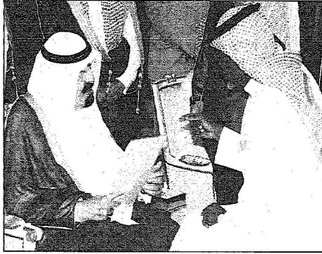
الملك عبدالله يستقبل الأمراء والمواطنين

وصاحب السمو الملكي الأمير الدكتور عبدالعزیز بن سظام بن عبدالعزيز وصاحب السمو الملكي الأمير عبدالعزيز بن فهد بن عبدالعزیز وزير الدولة عضو مجلس الوزراء ورئيس ديوان رئاسة مجلس الوزراء.