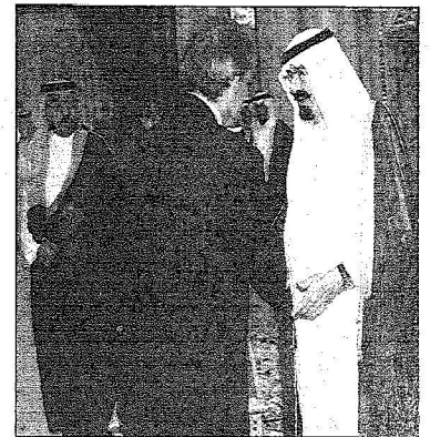
خادم الحرمين خلال استقباله الأمير هشام بن عبدالله