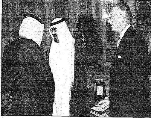
خادم الحرمين يستقبل للعبية