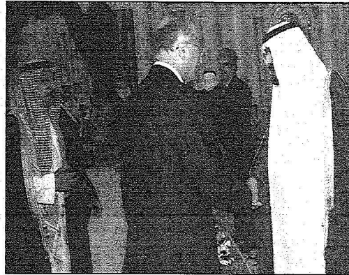
الملك عبدالله يستقبل أوغلي