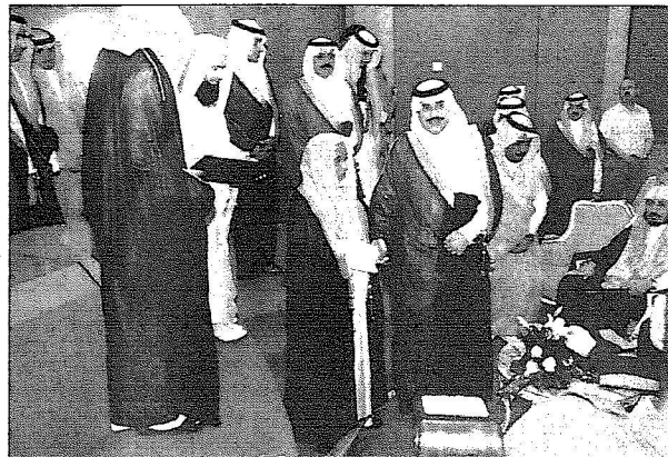
سموه ترحل من المنصة لتسليم الشيخ ابن زيد جائزته