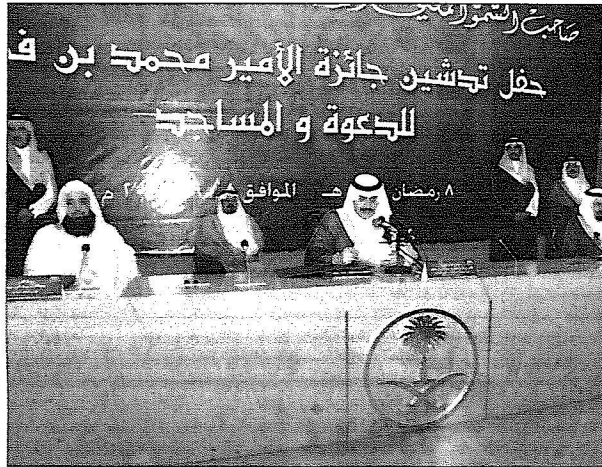
سموه على منصة الاحتفال