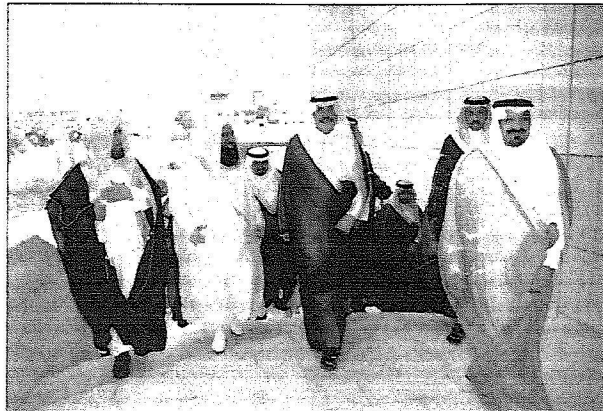
الأمير محمد بن فهد لحظة وصوله مقر الحفل