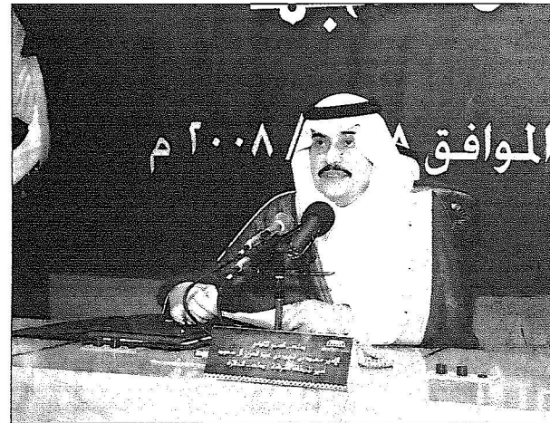
.. و يلقى كلمته بالحفل