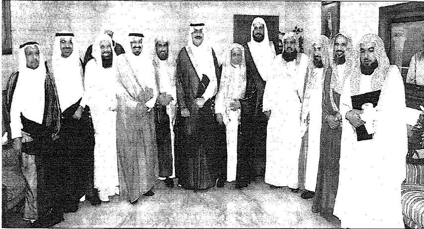
.. ويتوسط اعطاء الجائزة في لقطة تذكارية