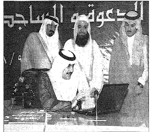
.. ويحدث موقع الجائزة