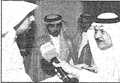
سمو وزير الداخلية يجيب على أسئلة الإعلاميين

وحول التوجهات التي تلقاها سموه و امراء المناطق بعد لقاءهم بخادم الحرمين الشريفين وسمو ولي عهده الأمين قال سموه ان