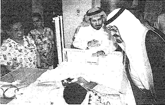
خادم الحرمين يزور أحد التوأمين الكامبرونيين بعد عملية فصلهما

تجاوز إلى ما هو أبعد من ذلك وهو رعايتهم بعد العملية وتوفير الرعاية الصحية الكاملة من علاجات أو عمليات تصحيحية مستقبلية أو تأجيل طبي وعلاج طبيعى إجراء العملية .