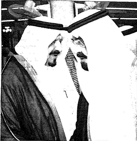
الملك وسموولي المدينة تادان التازي

أل ثاني ولي العهد بدولة قطر الشقيقة والوفد الراقق له. ونقل سموه لخادم الحرمين الشريفيين في بداية الاستقبال تحيات وتقدير صاحب السمو الشيخ حمد بن خليفة آل ثاني أمير دولة قطر فيما حمله الملك المفدى تحياته وتقديره لسموه. كما قدم سمو ولي عهد قطر تعازيه لخادم الحرمين الشريفيين في وفاة صاحبة السمو الملكي الأميرة لولوة بنت عبدالعزيز رحمها الله. وجرى كذلك خلال الاستقبال بحث عدد من الموضوعات ذات الاهتمام المشترك.