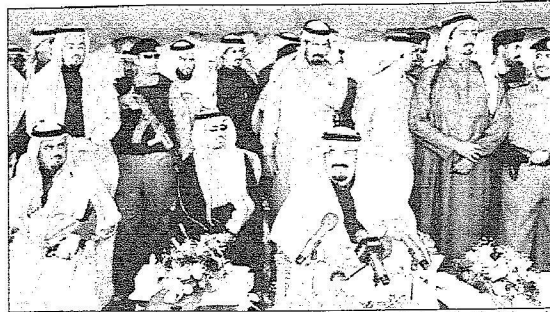
الأمير مشعل يلقي كلمته في الحفل

رعى صاحب السمو الملكي الأمير مشعل بن عبدالعزيز آل سعود ظهر أمس الحفل الختامي لمرحاض مزايين الإبل لقبيلة يام بهجرة غربية التابعة لمحافظة النعيرية، وبحضور الأمير تركي بن محمد بن فهد بن عبدالعزيز ومحافظ النعيرية سليمان بن حمد بن جبرين ورؤساء المراكز الإدارية وأعداد كبيرة من أهالي وادي العجمان، وبعد أن أخذ سمو الأمير مشعل بن عبدالعزيز مكانه في منصة الحفل بدأ حفل خطابي أقيم بهذه المناسبة بآيات من الذكر الحكيم رتلها على منساج الحضور الشيخ محمد القرني ثم ألقى عبدالله بن سديعان العمري كلمة نيابة عن صاحب فكرة المزايين فلاح بن سعود بين حديثين رهب عن خلالها بمقدم سمو