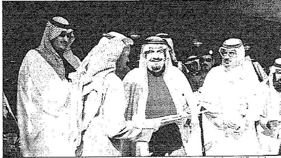
..و يسلم أحد الفائزين جائزته