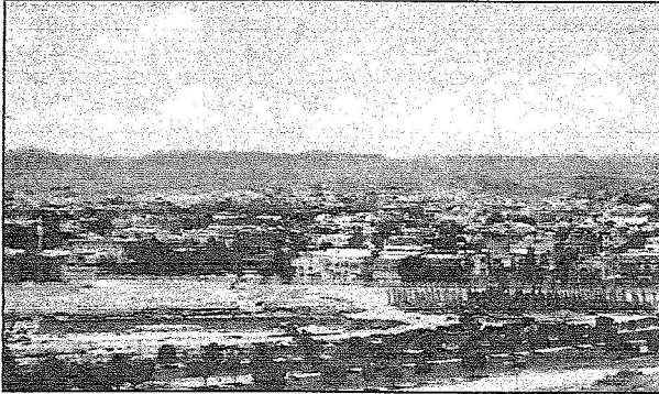
البنك العقاري ساهم في زيادة وتيرة النمو العمراني بالطائف