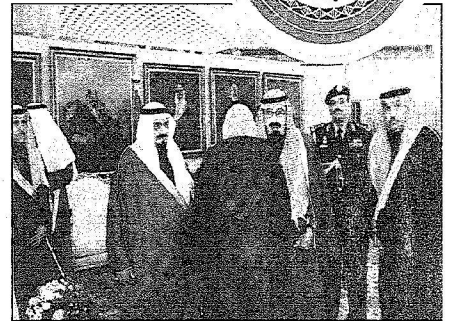
مغادرة خادم الحرمين الشريفين إلى مسقط