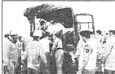
جانب من الجهود التي بذلت خلال وبعد الحادث