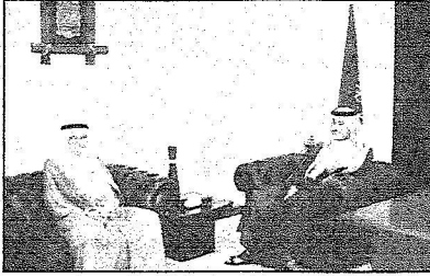
صورة من الاستقبال

وعلا ثم لولاية الأمر حفلهم الله حيث يستشعر الجميع في هذه البلاد المباركة قادة ومسؤولين ومواطنين هذا الواجب الكبير تجاه كل قادم لهذه البلاد التي تستقبل في كل عام ملايين الحجاج والمعتمرين والزوار للبيت الحرام ومسجد النبي الكريم ولدينا من القدرات البشرية والعاملية في هذه المجالات ولله الحمد من فخر بهم على كافة المستويات والحمد لله الذي وفقنا جميعاً للقيام بهذا الواجب على أكمل وجه. ويعد نهاية الزيارة تحدث السفير البحريني للصحفيين وقال ان الهدف من هذه الزيارة