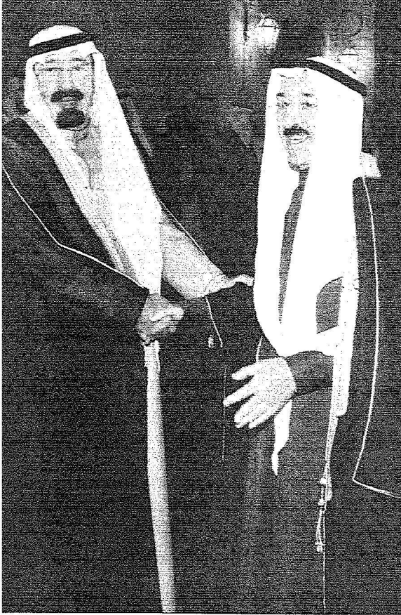
المليك والشيوخ صباح الأحمد في لقاء أخوي