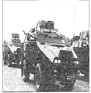
جانب من العرض الميداني