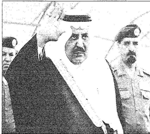
الأمير نايف يحيي منسوبي الطوائف الحكومية

وعن قرار سمو وزير الداخلية ورئيس لجنة الحج العليا باستحداث قوات خاصة للحج والعمرة قال الفريق القحطاني: إن هذه القوة سوف تشارك مع بقية الجهات الأمنية في موسم حج هذا العام تحزيرا ومطابرة في تقديم الخدمات الأمنية لوفود الرحمن. وفي ذلك شاهد صاحب السمو الملكي الأمير نايف بن عبد العزيز وزير الداخلية عرضا ميدانيا لعدد من