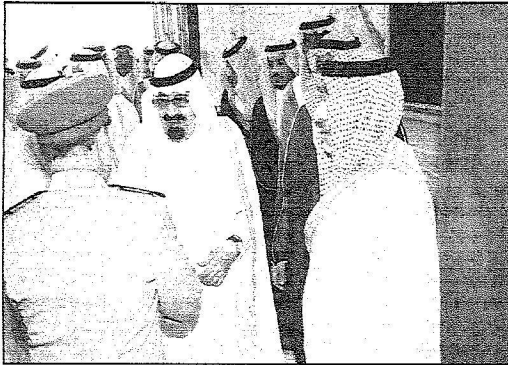
خدم الحرمين مستقبلاً لقيادات الأمانة

سيذكر الوطن أنكم درع منيع تداعى على صلابته وعنفوانه أعوان الشيطان من الفئة الضالة