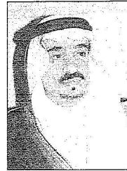
سمو أمير منطقة القصيم