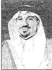
سمو نائب أمير منطقة القصيم