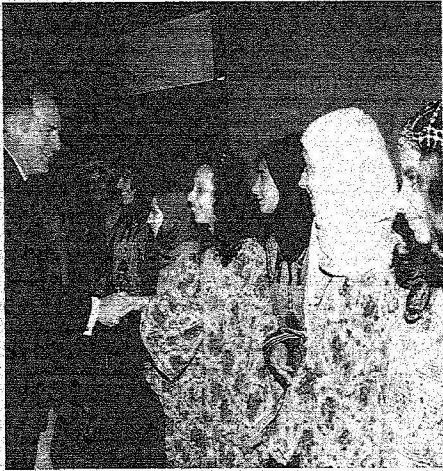
كيم هاوايز وزير الدولة البريطاني للشؤون الخارجية يصافح مجموعة من الفتيات السعوديات بالثياب التراثية في افتتاح معرض «اكتشف السعودية»