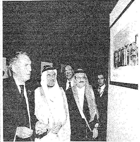
اياد عتي وزير الاعلام السعودي والامير محمد بن نواف سفير السعودية في بريطانيا مع كيم هاوايز وزير الدولة البريطاني للشؤون الخارجية في الافتتاح