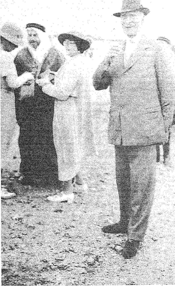
ايرل أتلون زوج الاميرة اليس يحتمي القبوة العربية وتظهر الاميرة اليس في الصورة وهي تتحدث الى عبد الله فيليبي

ورش العمل الخقامة على هامش المعرض والتي يشارك فيها عدد من طلبة المدارس في بريطانيا والتي يتدرب فيها الطلاب على الرسومات الهندسية التي ميزت الفن الإسلامي. اما الجزء المعنون «ذكريات القرن» والذي احتل جزءا كبيرا من القاعة فكان الأكثر جذباً للزوار وفيه عرضت صور من بدايات القرن لرحلة الاميرة اليس حفيددة الملكة فيكتوريا الى السعودية