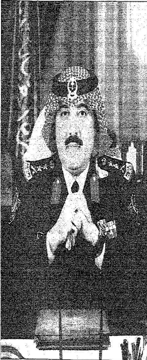
الأمير متعب بن عبد الله

وقال مساعد قائد كلية الملك خالد العسكرية اللواء عيسى بن إبراهيم الرشيد: إنه لشرف كبير لنا جميعاً تشريف صاحب السمو الملكي الفریق أول ركن متعب بن عبد الله بن عبد العزيز نائب رئيس الحرس الوطني المساعد للشؤون العسكرية حفل تخريج الدورة التاسعة عشرة من الضباط الجامعيين والدفعة الرابعة والعشرين من طلبة الكلية ، حيث يعد تشريف سموه وساماً يعتز به منسوبو الكلية وخريجوها ويعت فيهم روح السعادة ويقوي عزائهم على الارتقاء بالأداء الى الأفضل .