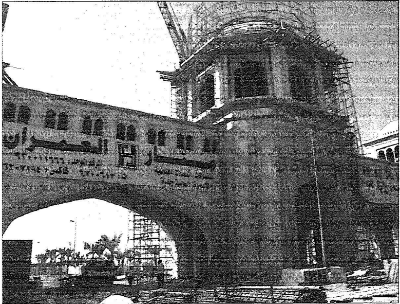
بوابة مدينة الملك عبدالله الاقتصادية

➤ ٥٠ شابة سعودية يعملن في مجال السقالات المعدنية وقوالب الصب