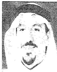
الأمير الدكتور فيصل بن مشعل