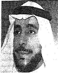
د. سلطان بن عبدالعزيز