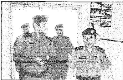
المقبل يتلقى قسم رخص السير والقيادة