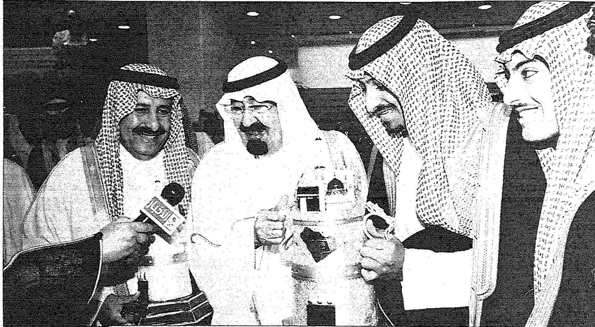
خادم الحرمين الشريفين يسلم البارحة الأولى في الجندارية - الرياض أبناء الأمير محمد بن سعود الكبير كأس المؤسس بعد فوز الفرس (مكانة) بالشوط السابع من التصفيات.